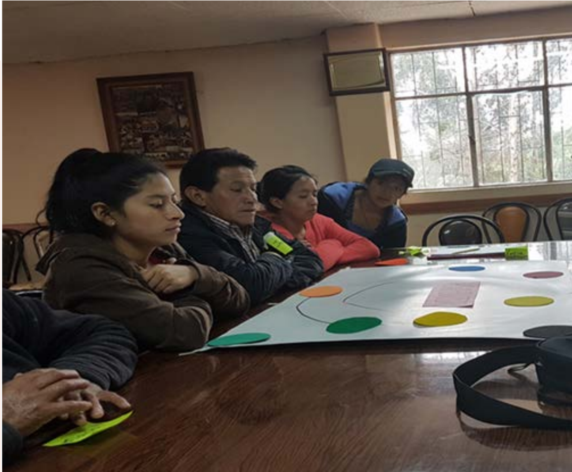
Reuniones en la Comunidad

ASOPROTUR es una organización ubicada en SAN PEDRO DE HIERBABUENA; Parroquia TURI, Cantón Cuenca conformada por hombres y mujeres campesinas que busca mejorar la calidad de vida de los habitantes dando respuesta a: