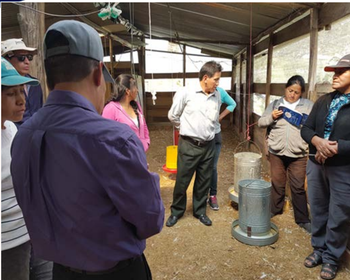
Capacitación en manejo de galpones