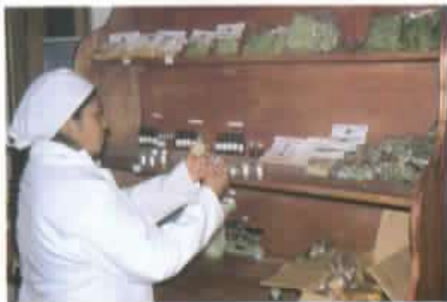
Hierbas medicinales y aceites esenciales.