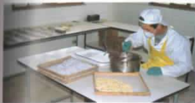
Elaboración de chocolates.