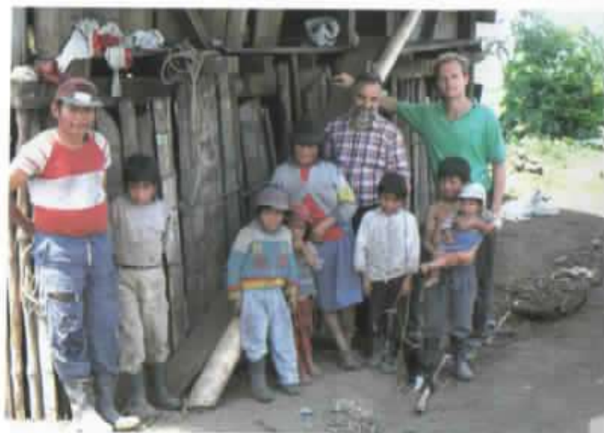
... y el subtropical de Salinas, ¡cuánto falta por hacer!