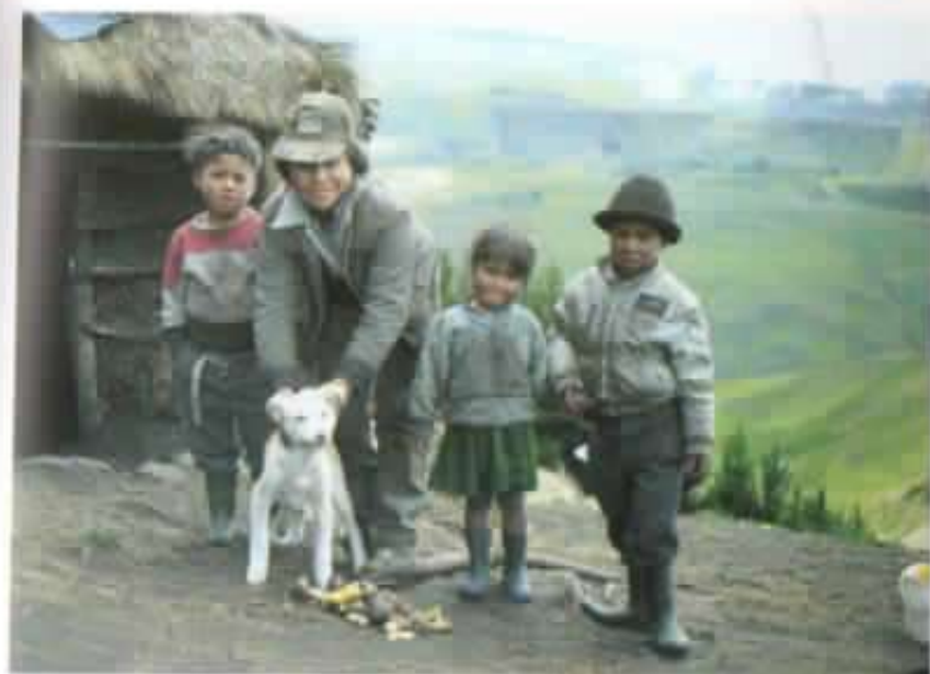
Dignidad y pobreza en el páramo...