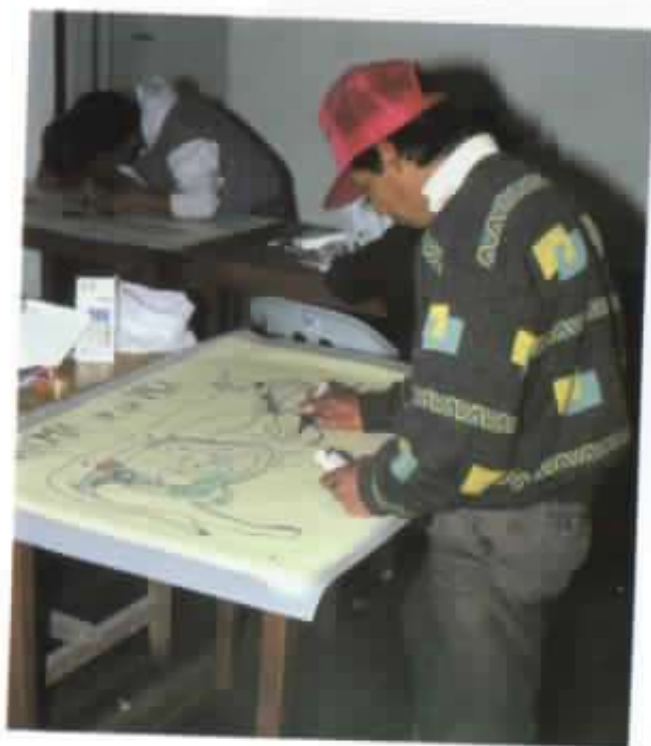
Los jóvenes se capacitan en temas sociales, técnicos y administrativos.