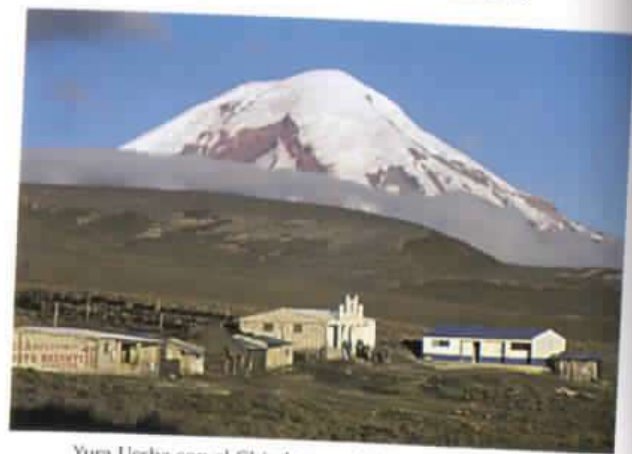
Yura Usha con el Chimborazo. 6310 metros de altura.

Manejo agroforestal y silvopastoril: luchando contra el frio y la erosión.