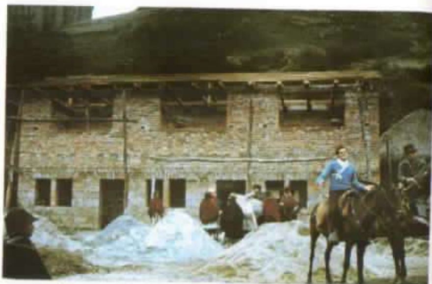
Construcción de la Casa Comunal, verano de 1971.