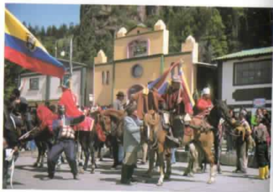
Los Reyes Magos con sus vasallos.

encuentro para cuantos quieren vivir - y ayudar a que siga viviendo - la prioridad de la persona sobre el predominio del dinero.