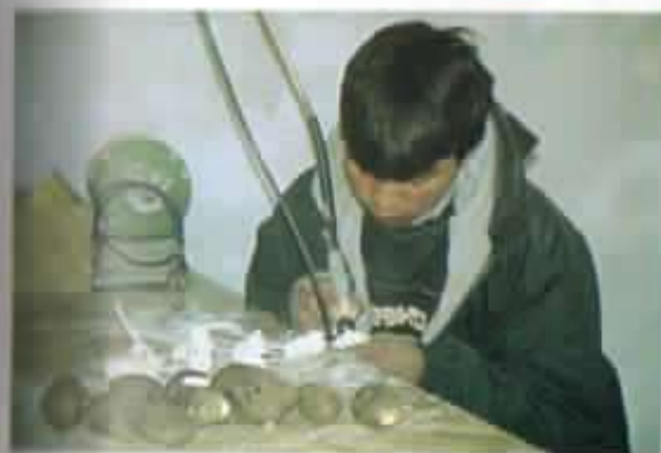
Producción de artesanías en tagua.