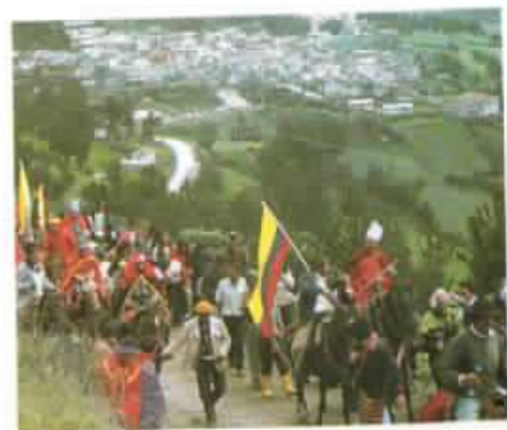
Fiesta de Reyes: Procesión del pueblo al Estadio.