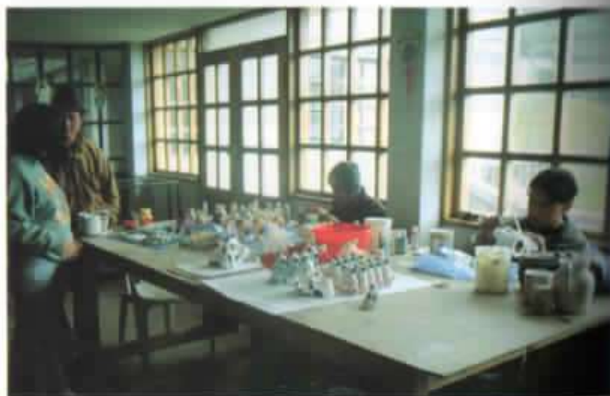
Elaboración de cerámicas.

protección". Era la primera alumna enfermera de las voluntarias inteligente y sensible, atenta y solícita; nos dejó a todos con un sentimiento profundo de dolor y admiración de lo que es aprender para entregarse. Se nos fue, como ya hemos mencionado, a los pocos días de haber dado a luz, confiando de que a ella le hubiesen dado los mismos cuidados, que ella daba a los demás.