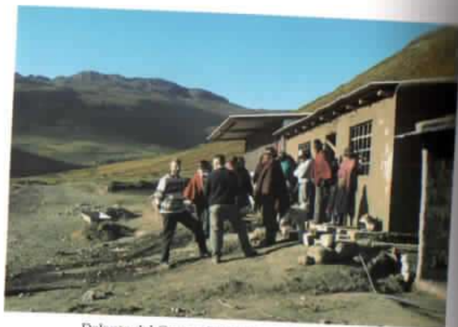
Delante del Centro Femenino en Pachancho.