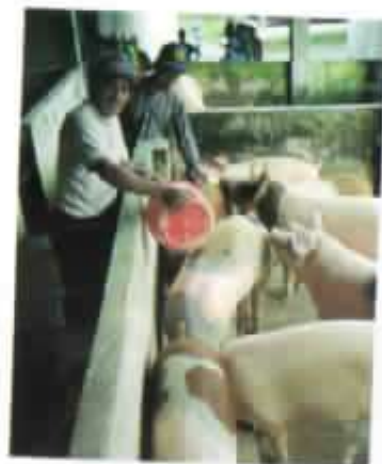
Criadero de cerdos de la FUNORSAL en Chazojuan.