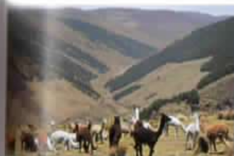
Alpacas: Manejo sustentable de los páramos y nueva fuente de ingresos.

Si hasta ahora se puede aceptar que una parte de esta carga ideal era representada por el Padrecito, es alentador comprobar que varios miembros de la Familia Salesiana y líderes comunitarios han asumido íntimamente los valores y la vocación a mantenerlos vivos en su trabajo. Así mismo es vital el aporte que se espera desde el otro lado del puente: el flujo de voluntarios (jóvenes, maduros, jubilados...turistas y tesistas) no está destinado tanto y exclusivamente a traer recursos técnicos y económicos, cuanto a premiar con el efecto que los sicólogos llaman refuerzo los valores cuyo atractivo les trae a Salinas. Buscando la realización de un sueño de solidaridad humana, que en su tierra de origen consideraban muerto, contribuyen en forma eficaz a mantenerlo con vida. La globalización de los intereses ha dejado en Salinas un fisura, un nicho abierto a la globalización de la solidaridad, un espacio privilegiado de