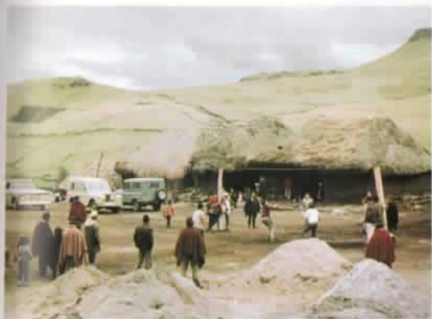
Plaza de Salinas, verano de 1971.