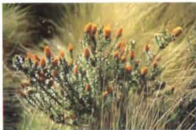
Chuquiragua bella flor del páramo.