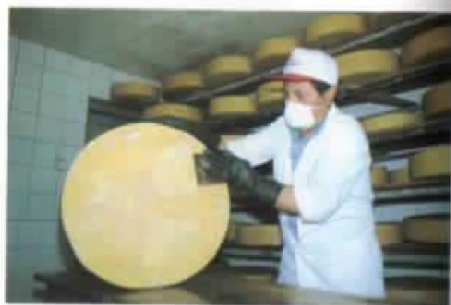
Un queso Gruyère, orgullosamente Salinero.