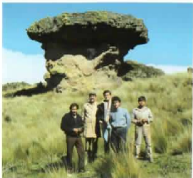
Grupo de voluntarios y moradores delante de "Sombrero Rumi".