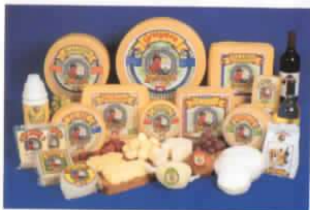
Sabrosos quesos, más y más valor agregado para los productos campesinos.