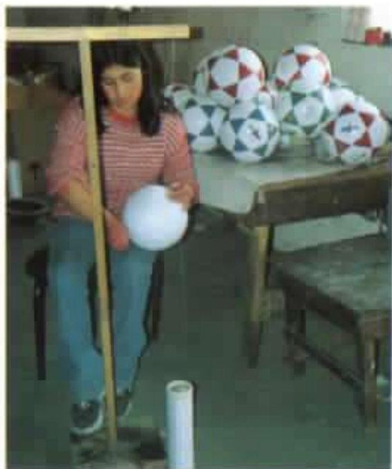
Iniciativas privadas complementan las comunitarias, empresa familiar de balones de fútbol