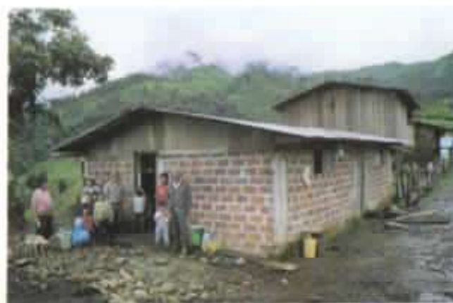
Quesería de Copalpamba.