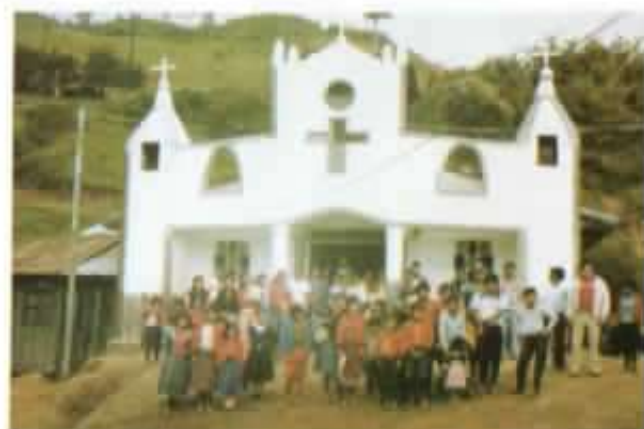
Arquitectura religiosa popular en la Palma.