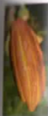
Cacao, fruto delicioso de nuestra tierra.