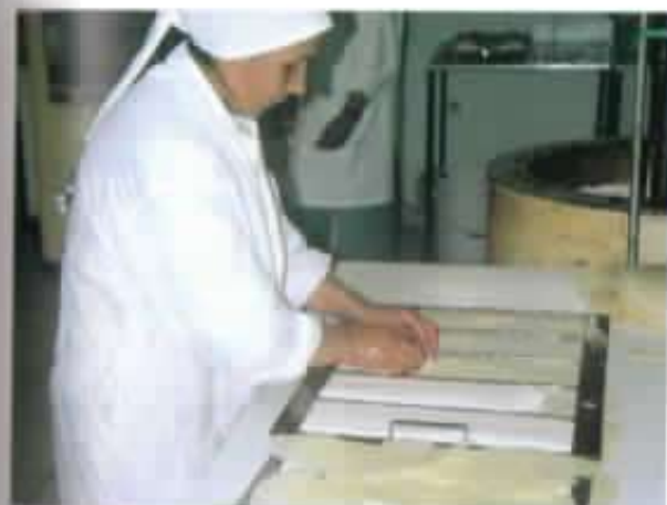
Elaboración de turrónes.