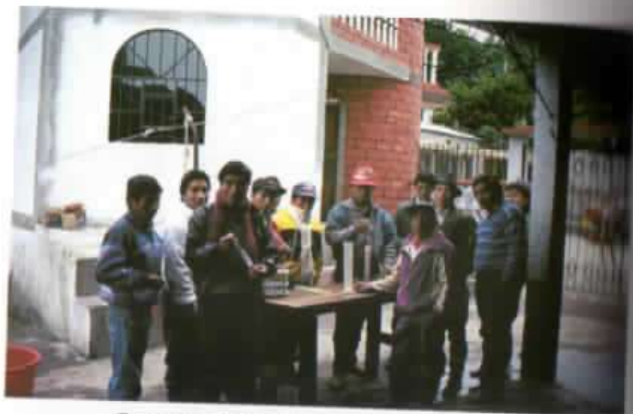
Curso de capacitación para futuros lecheros.