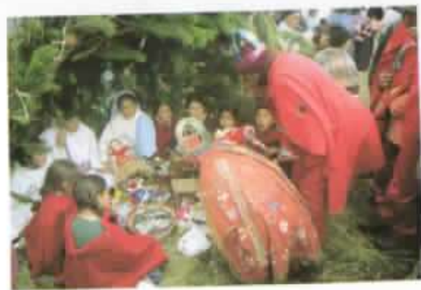
"... y arrodillándose lo adoraron".