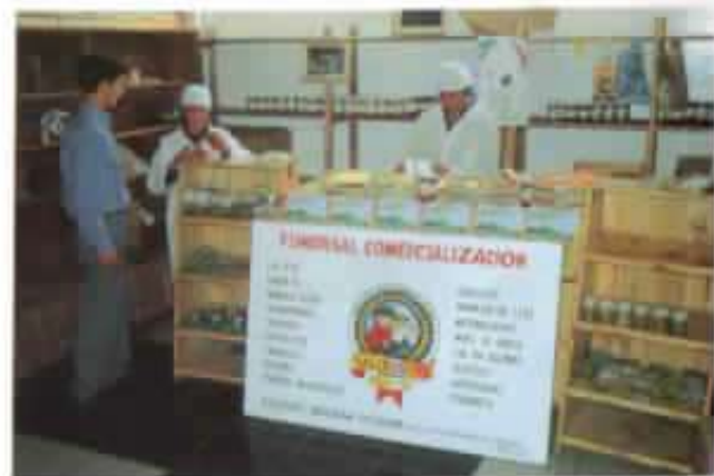
Herida para la comercialización.