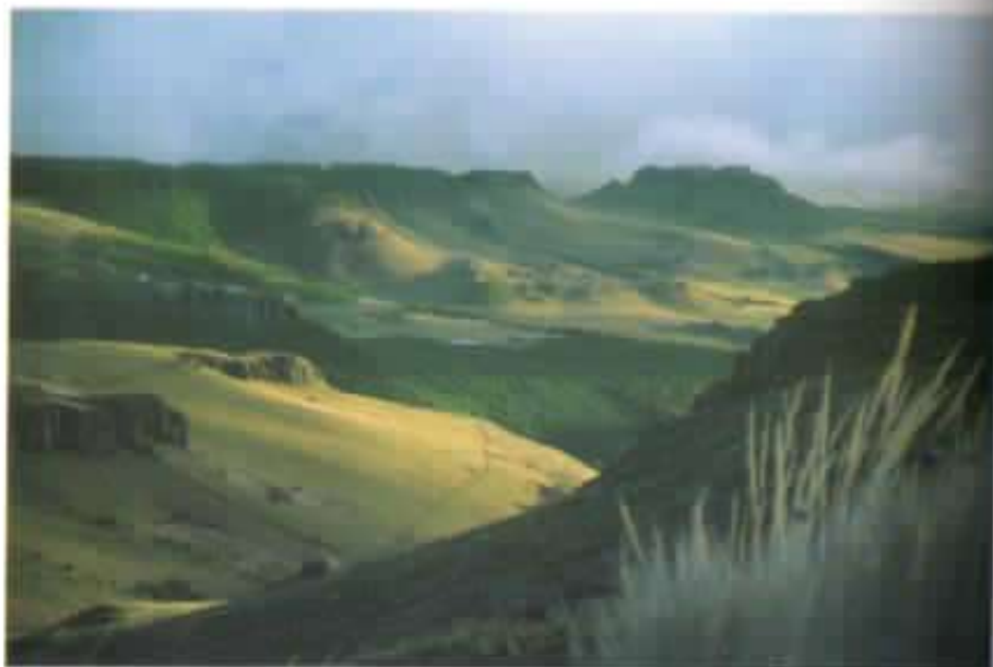
Los jóvenes plantan árboles y esperanzas en los páramos.