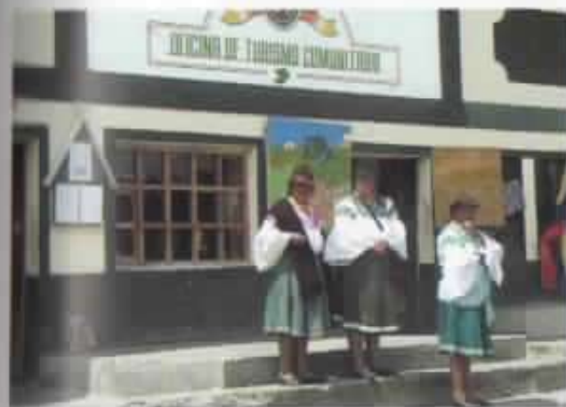
Visión y desarrollo empresarial, la Oficina de Turismo