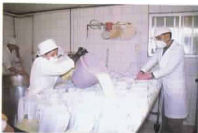
Cuajado de la leche.