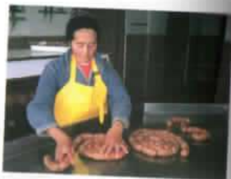
Elaboración de embutidos.