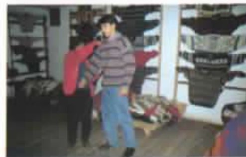
Centro de venta de la Texal.