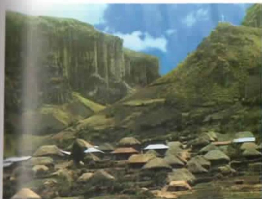
Salinas, verano de 1971.