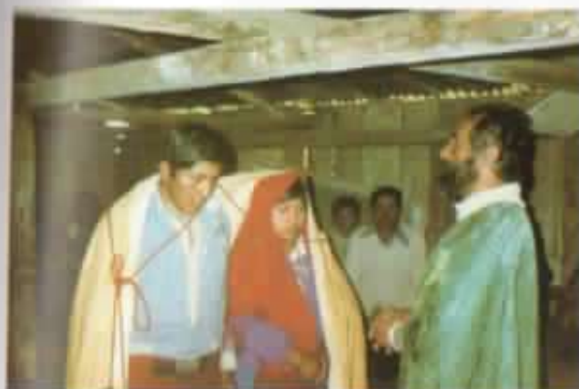
Matrimonio indígena en una capilla del subtropical.