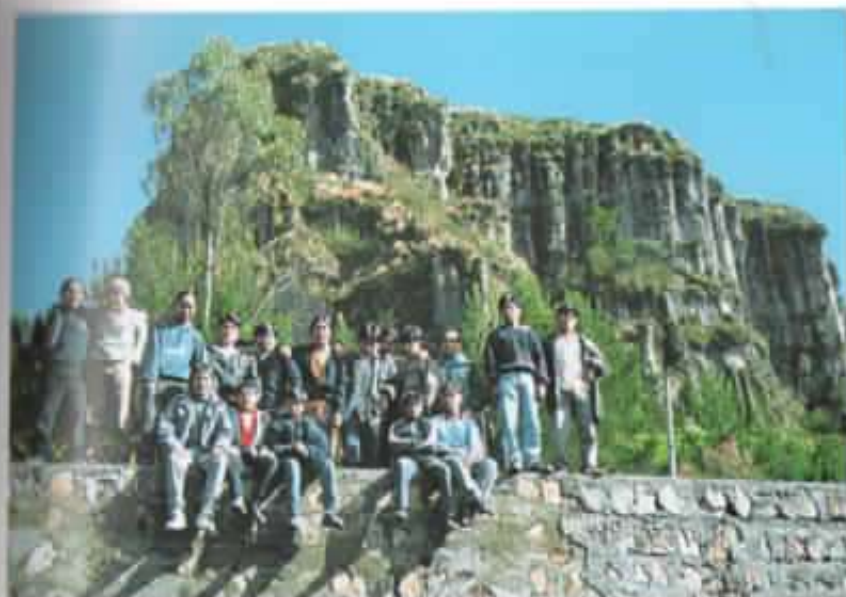
Jóvenes del hogar juvenil de varones.