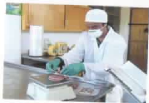
Higiene y cuidado en el empaqueo de los productos.