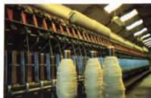
Hilandería de Salinas.