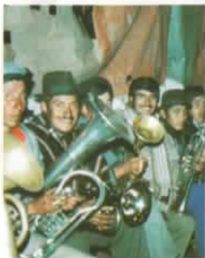
La primera banda Salinera.