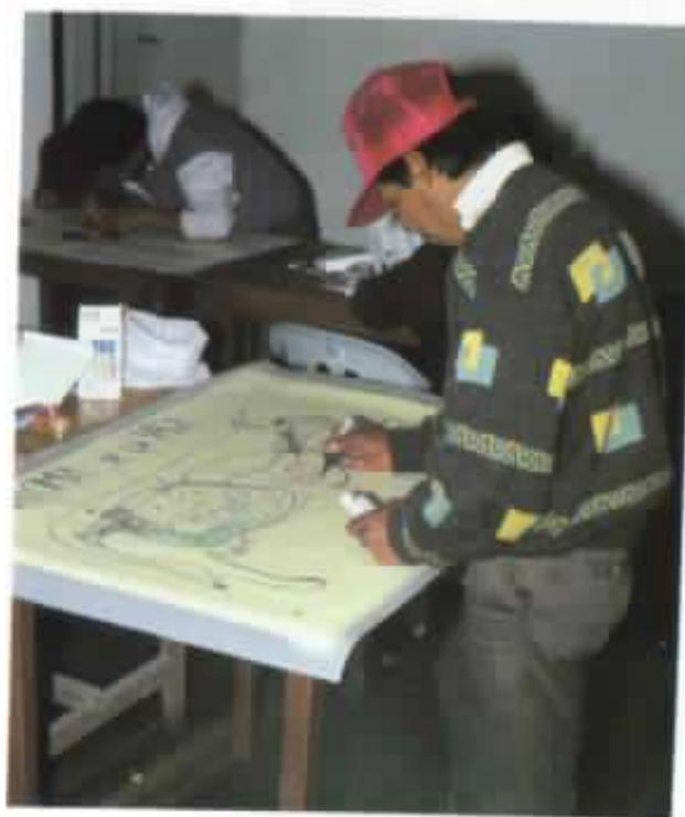
Los jóvenes se capacitan en temas sociales, técnicos y administrativos.