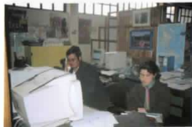
La oficina de la Misión Salesiana.