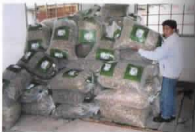
Embodegado para la distribución.