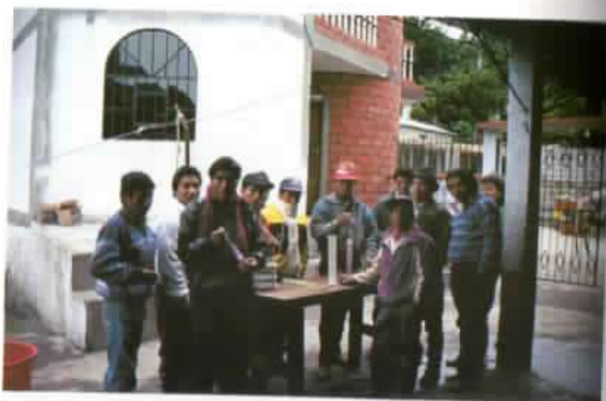
Curso de capacitación para futuros lecheros.