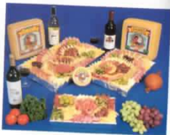
Una deliciosa variedad de embutidos "El Salinerito".