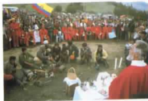
Misa campal en el Estadio.