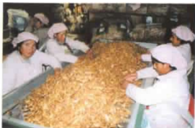
Secado y clasificación de los hongos