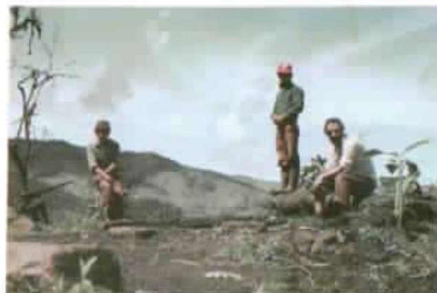
Los primeros trabajos en el subtropical ya deforestado.

Respecto a la Cooperativa Salinas, la Misión apoya decididamente el camino a la creación de un "Banco Salinero".