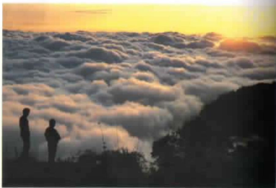
La naturaleza invita a soñar.