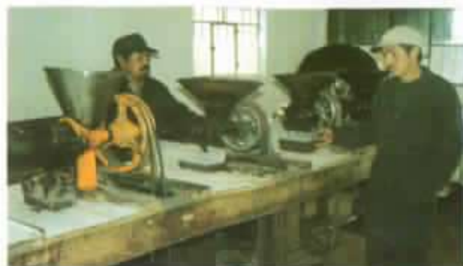
Viejas máquinas para hacer chocolates riquísimos.