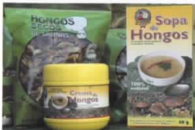
Hongos de Salinas y sus derivados listos para la exportación.