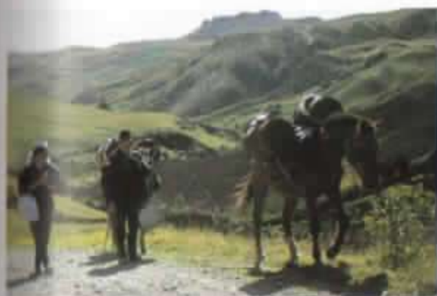
Transporte de leche a la quesería.