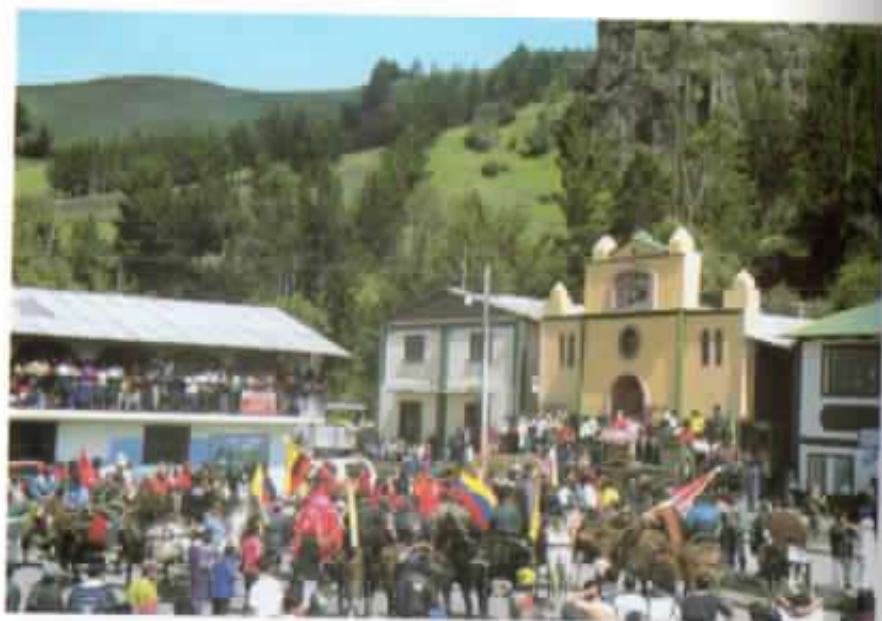
6 de enero: Salinas de fiesta, 2002.