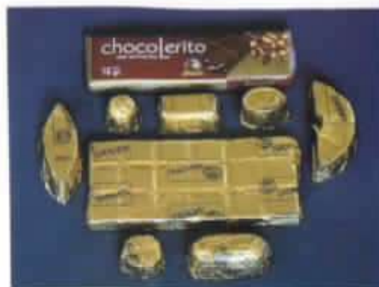
La calidad y elegancia de los productos trascienden nuestras fronteras.