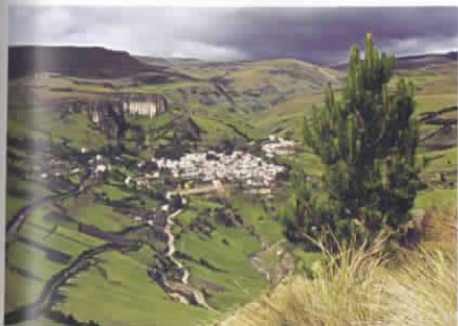
Salinas cabecera parroquial, 1994.