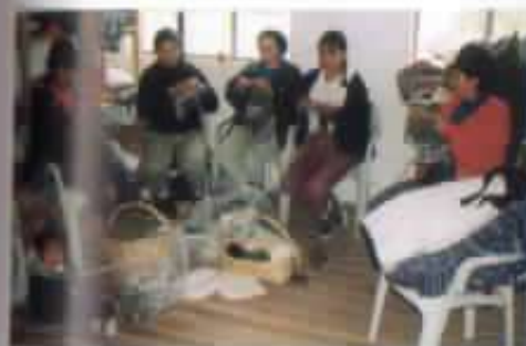
Trabajando en comunidad y con creatividad.