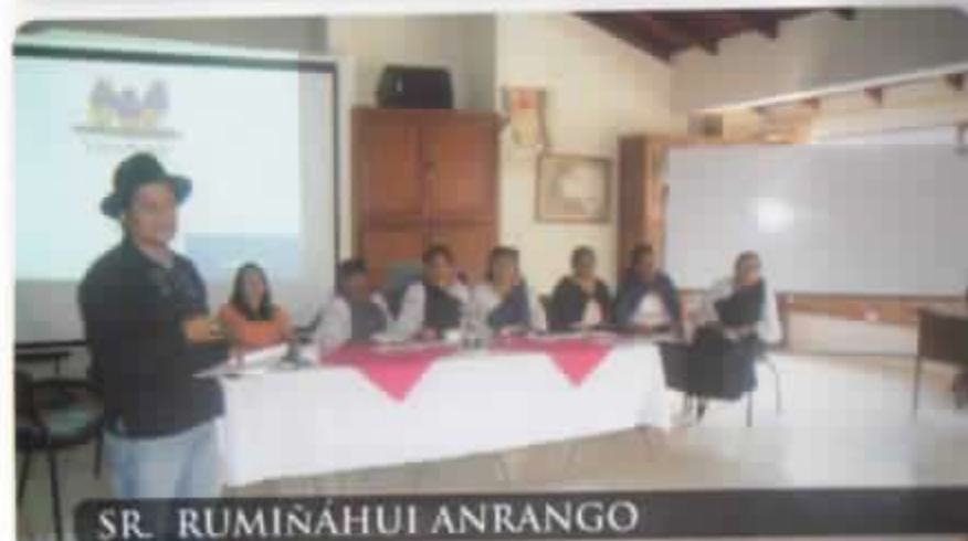
SR. RUMIÑAHUI ANRANGO

CAJA DE AHORRO Y CREDITO TUNIBAMBIA UNORCAC