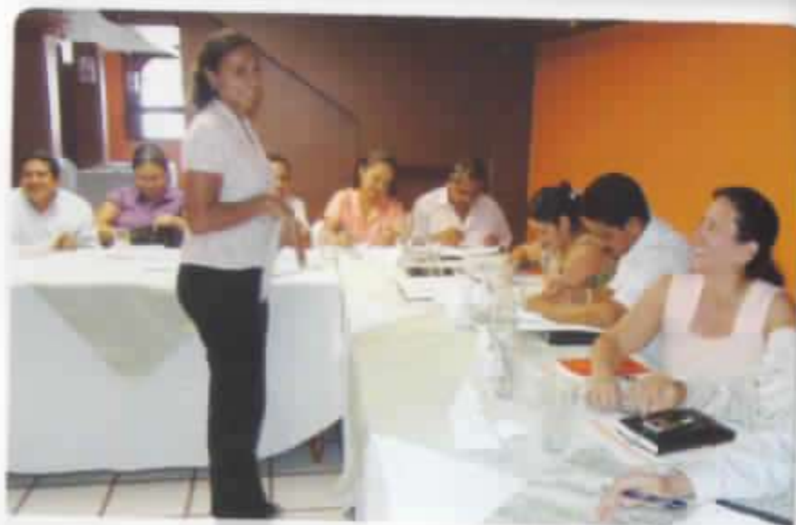
TALLER DE CAPACITACIÓN

La capacitación que ejecutó el PNFPEES con Swisscontact fue muy importante, porque ha mejorado el conocimiento de los técnicos o empleados de la institución y también de directivos, se ha aplicado lo aprendido en las Cooperativas y esto ha dado buenos resultados.