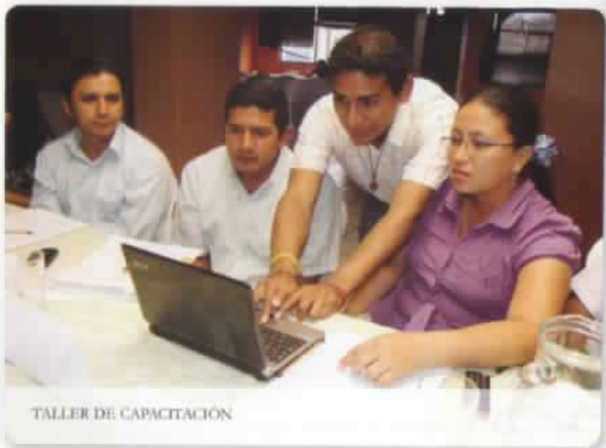
TALLER DE CAPACITACIÓN

EX COORDINADOR PROYECTO "CANAL DE DISTRIBUCIÓN DE REMESAS DE PEQUEÑOS INTERMEDIARIOS FINANCIEROS"