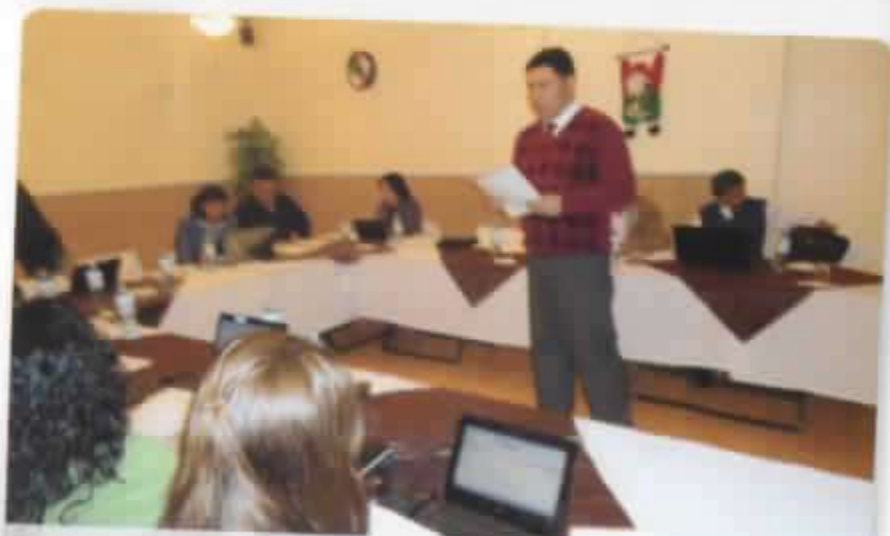
TALLER DE CAPACITACIÓN

DIRECTOR EJECUTIVO FUNDER FUNDACION EDUCATIVA MONS. CANDIDO RADA